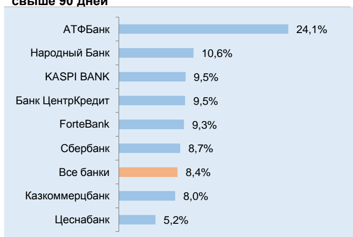
Рис 4 Доля кредитов с просрочкой платежей свыше 90 дней