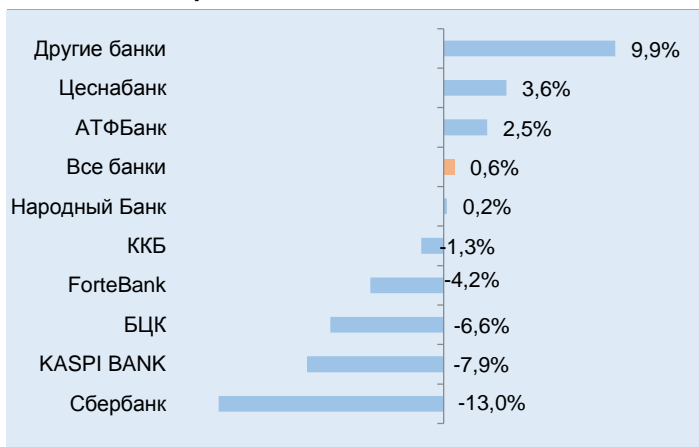
Рис 1 Рост кредитов с начала года